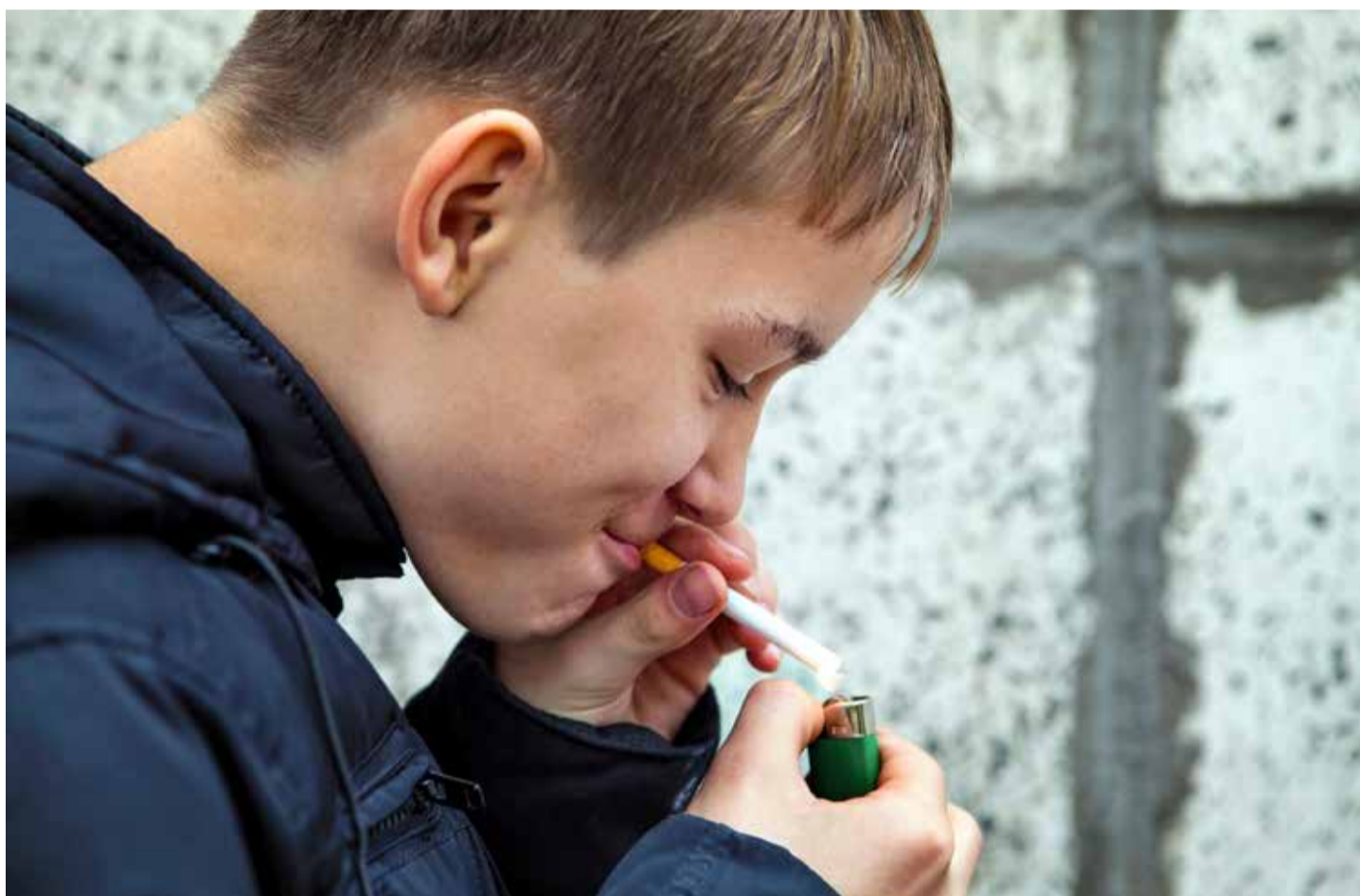
A Fribourg, 65% des garçons et 33% des filles de 15 ans ont déjà fumé une cigarette.