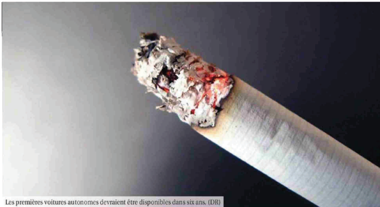
Les premières voitures autonomes devraient être disponibles dans six ans.